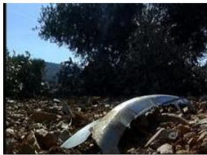
El vehículo chocó contra un olivo que fue arrancado de raíz por el impacto.